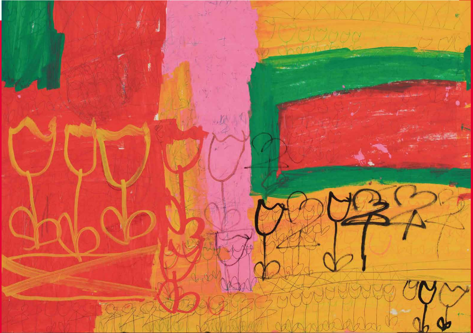
表紙「相合傘、チューリップ」阿部美幸／MIYUKI ABE

対談 朝日印刷工業・石川 靖会長に聞く 組合行事報告／青年部北海道視察研修 埼玉いいところめぐり in 浦和